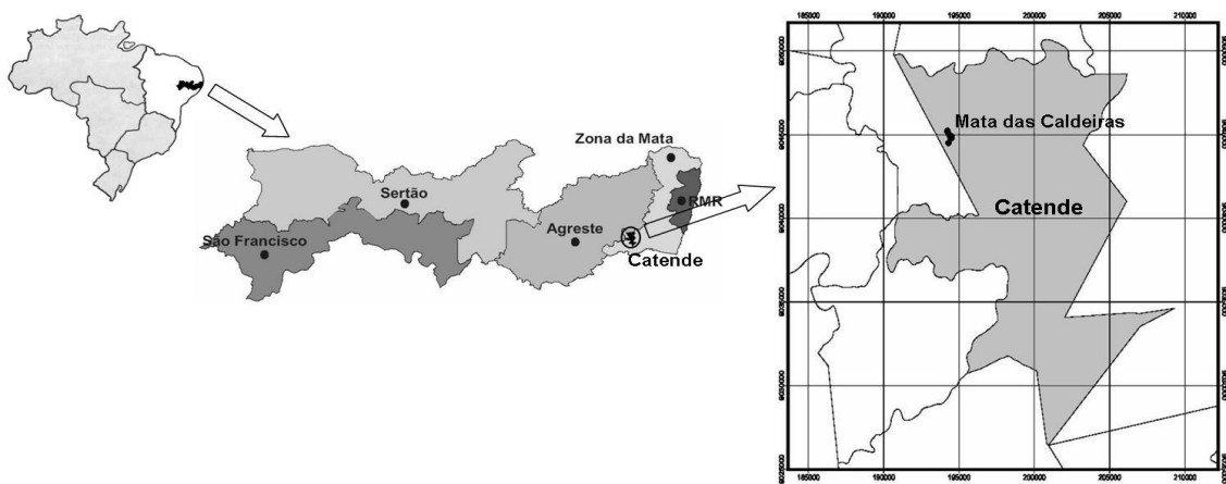
Figura 2. Localização da área de estudo, fragmento de Floresta Atlântica, Mata das Caldeiras, município de Catende, PE.

Segundo a classificação de Köppen, o clima de Catende é do tipo As', tropical chuvoso com verão seco e estação chuvosa adiantada para o outono, antes do inverno. O período de maior umidade corresponde aos meses de abril a junho. A temperatura média anual ultrapassa 22°C e a precipitação média anual é de 1.414 mm. O relevo predominante varia de ondulado a forte ondulado. O solo predominantemente, encontrado na área geográfica em estudo, é do tipo Argilossolo Vermelho-amarelo distrófico.